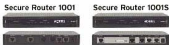
Рисунок 1. Масштабируемость устройств семейства Secure Router

Маршрутизаторы Secure Router 1001 и 1001S предназначены для использования на удаленных узлах и объектах, нуждающихся в прямом подключении к Интернету. Имея один порт T1/E1 или один последовательный порт, маршрутизаторы Secure Router 1001 и 1001S представляют собой высокоэффективные устройства, построенные на функционально богатой платформе. Их пропускная способность может наращиваться с одного дробного потока T1/E1 до потока T1/E1 со скоростью обработки трафика, равной скорости передачи в линии и выше, даже когда передаются небольшие пакеты, и активированы ресурсоемкие сервисы. Для повышения устойчивости системы может быть задействован резервный интерфейс ISDN BRI.